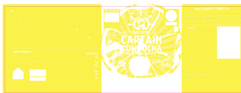
PANTONE 101 C