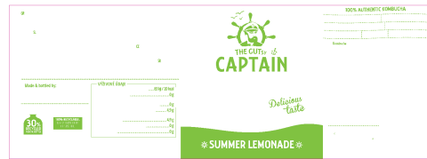
PANTONE 3561 C